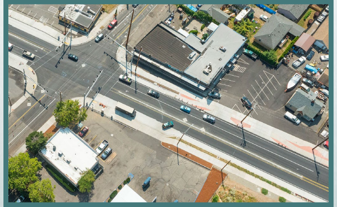
Các cải tiến được xây dựng gần đây trên Đại lộ SE Powell tại SE 136th Avenue.

Công việc thiết kế hiện đang được tiến hành trên các đoạn còn lại của Đại lộ Outer SE Powell. Vĩa hè, làn đường dành cho xe đạp và làn rẽ ở giữa là một số cải tiến an toàn đang được thiết kế trên toàn bộ đường đi. ODOT đang thiết kế phần còn lại của đường đi để phù hợp với những cải tiến đã hoàn thành trong Giai đoạn 1. ODOT sẽ hoàn thành thiết kế vào mùa thu năm 2022 và việc thi công sẽ bắt đầu vào đầu năm 2023.