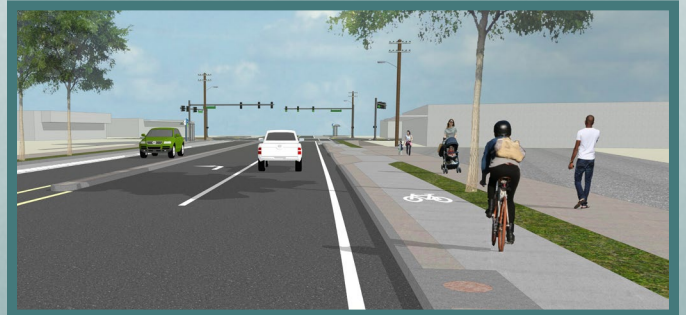
Hình minh họa làn đường dành cho xe đạp ở vỉa hè.